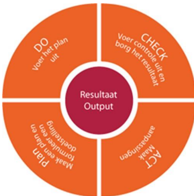
Figuur 3: Proces volgens Deming cirkel

Het realiseren van de CO 2 -doelstellingen, zoals beschreven in Hoofdstuk 6, gaat volgens een cyclisch proces geënt op het model van Deming. Het proces gaat van start in het onderdeel PLAN waarbij de bestaande situatie wordt onderzocht en een plan voor verbetering wordt ontwikkeld. Concreet is er een vertaling gemaakt naar reductiedoelstellingen. Vervolgens worden de geplande verbeteringen in uitvoering gebracht in het onderdeel DO. Het resultaat van de verbetering wordt gemeten, dit vindt plaats in het deelproces CHECK. Na beoordeling van de behaalde resultaten kunnen getroffen maatregelen worden bijgesteld in ACT. Het proces is weergegeven in figuur hieronder